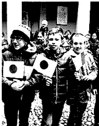
Como in festa per Tokamachi

Un laboratorio di ikebana, una cena giapponese e un pomeriggio dedicato alle fiabe giapponesi. Questi gli appuntamenti in programma per i prossimi giorni, nell'ambito dei festeggiamenti per i 40 anni del gemellaggio tra Como e Tokamachi.